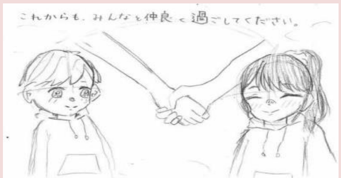
みなみ りゅう 南 麗妃