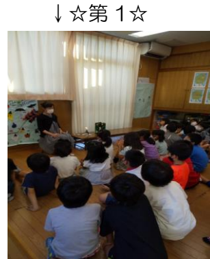
【読み聞かせ】わくわく、みんな集中して聞いてます♡