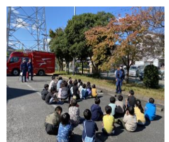
【避難訓練】消防署協力の下の訓練です。子ども達からは「すごい！中には沢山の用具があるよ」の歓声が。