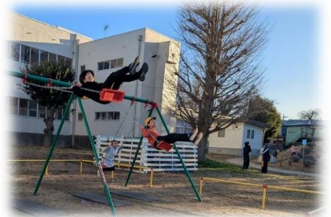
なわとび↓ ブランコ↑ たこあげ↓