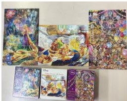
現在、クラブ内でプームのジグソーパズル！みんなで協力して色々なパズルに挑戦しています。