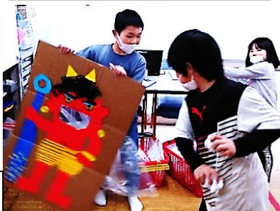
上級生の鬼は動きます 動く鬼も入れる方も必死の迫力👁️