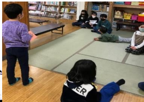
👁️誕生会の質問コーナー