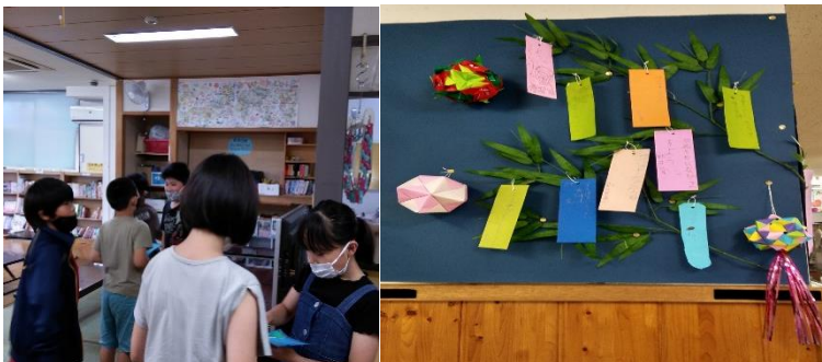
誕生日会で誕生日カードを子ども同士渡します。

★以前お配りしたクールネックタオルをお持ちください。外遊びで使います。また着替え袋の中身の確認をお願いいたします。