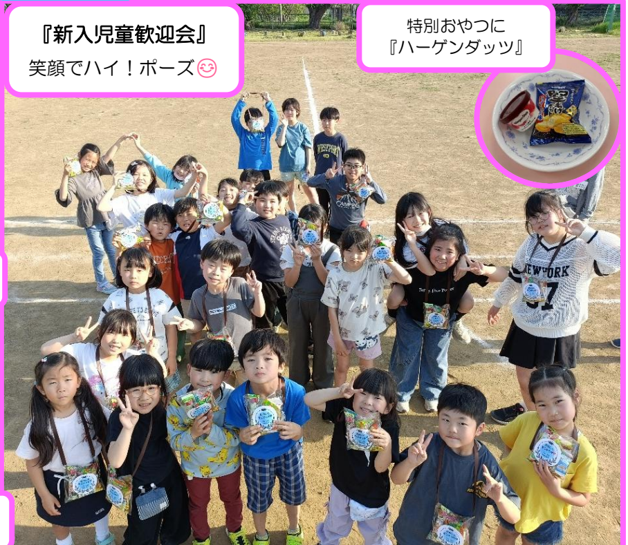
特別おやつに 『ハーゲンダッツ』