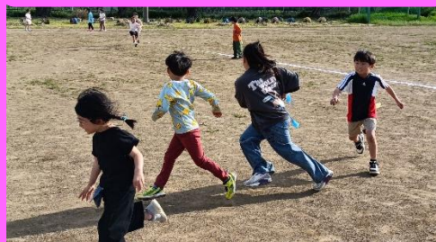
レクゲーム『しっぽとり鬼ごっこ』