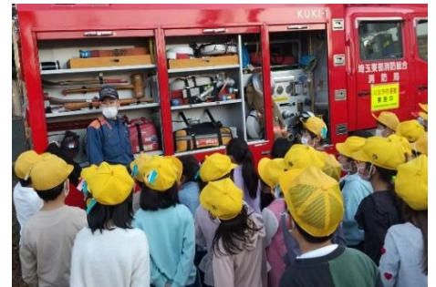
消防自動車を見学する子ども達

久喜消防署立会いのもと、11月15日(月)避難訓練を行いました。学童では、今年2回目の避難訓練です。1年生は消防士さんの姿を見て、緊張したようです。台所からの出火を想定して、速やかに校庭へと避難しました。点呼もスムーズに行い5分で行動することが出来ました。避難する際、話したり駆けたりする様子もありました。いざという時慌てることなく(お・か・し・も・ち)の行動がとれるようにと消防士さんより話がありました。