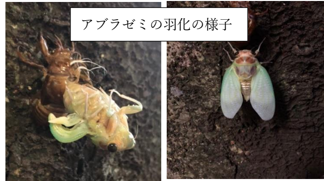
アブラゼミの羽化の様子

8月生まれの子のお誕生日をみんなでお祝いしました。今回のおやつはピザ!!! 普段は出ないおやつなのでとても喜んでいました。