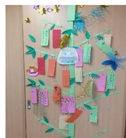
願い事を書いた七夕飾り

水ヨーヨー、ジュース輪投げ、お菓子じゃんけんなどの好きなお店を回り子どもたちの歓声が響きました。5年生はお店のお手伝いをしてくれました。みんなで楽しい時間を過ごしました。