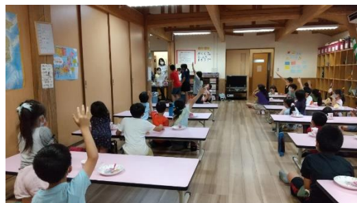
お誕生日のお友だちに質問!

7月16日(金) 共催保護者会 18:30~ 7月21日(水) 昼食提供 7月29日(木) 夏祭り 7月30日(金) 誕生会