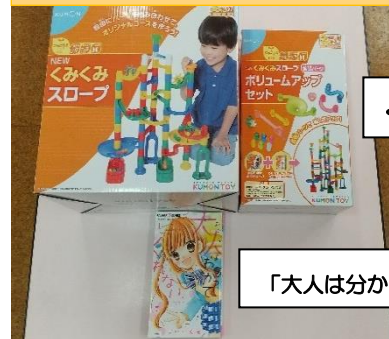
くみくみスロープ