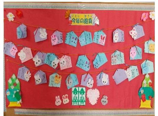
子ども達が作った卯の絵馬

また、「家族が病気になったり、友だちが怪我をしたりしませんように」と自分以外の事を願う絵馬もあり、人を思いやる気持ちが育っていることを嬉しく思いました。絵馬には、好きな色の折り紙で干支のうさぎを折って貼り付けました。カラフルで可愛らしい絵馬が出来上がり、壁に飾ると、華やかな新年の雰囲気になりました。