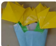
1年生の女の子の作品