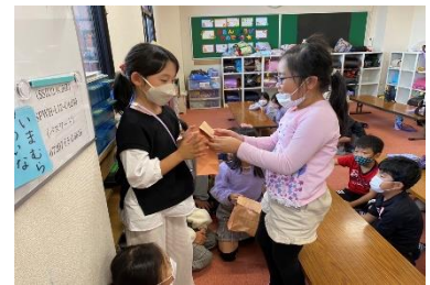
★お誕生日おめでとう！

新しいおもちゃは、ヘックメック、ルービックレースーマスター、ハゲタカのえじきです。 連日大人気で、順番待ちをしている子もいます♪