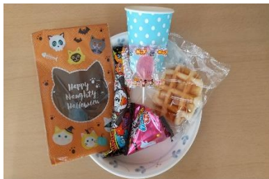
★ハロウィンおやつ♪