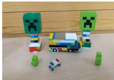
★レゴで作った大作です!(^^)!