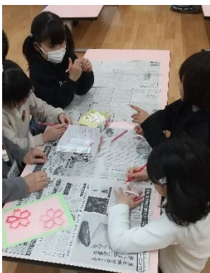
色塗り頑張りました!!