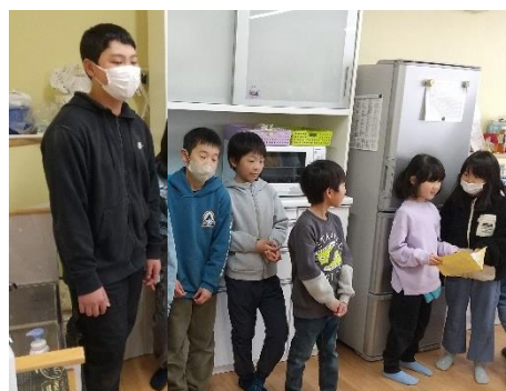
思い出を振り返ってくれました。