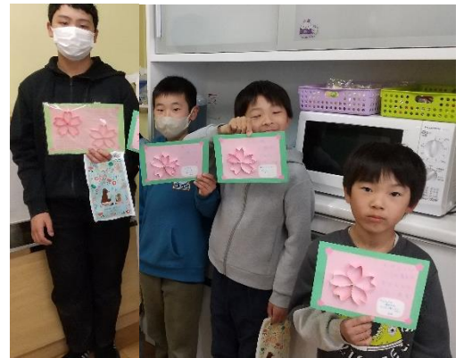
みんなおめでとう!!

退所児童には、1・2年生が頑張って塗ってくれた桜の花びらで作ったカードをプレゼントしました。