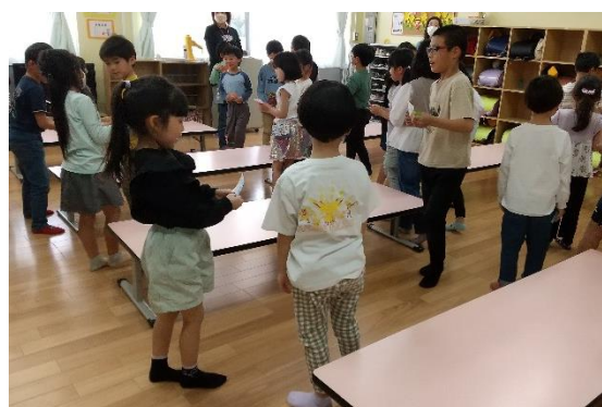
色々な学年の子と、名刺交換を楽しみました！