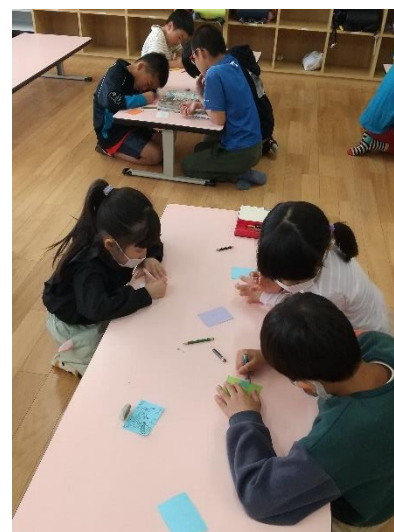
黙々と名刺づくり。2年生はキャラクターなど得意な絵を描いてくれる子が沢山いました。

ゲームの後はスペシャルおやつ！今回はショートケーキ or シャーベットゼリーにしました。ケーキが苦手な子も凍らせて食べるゼリーの食感を楽しんでいる様子が見られました。