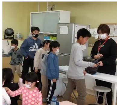
なんの食材が出るかな～？