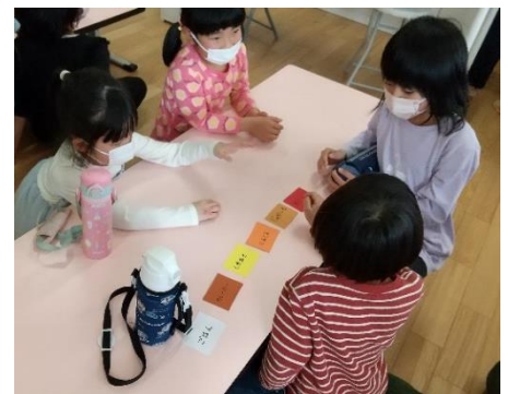
やったー！そろったよ！