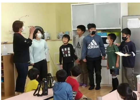
楽しかったことはなにか？

その後、班対抗のカレーライスゲームを行いました。すぐに6つの材料がそろい、「やったー！」「よっし！」と喜ぶ班や、「あと1つ！」と言いながらなかなかそろわない班もありましたが、みんな大騒ぎでとても盛り上がりました。