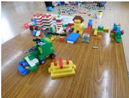
戦車やライオン、ケーキなど レゴでたくさん作りました。