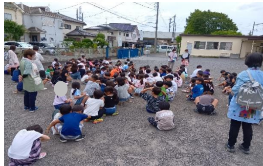
5/27 火災避難訓練を行いました。 しっかりとお話を聞き、速やかに避難できました。